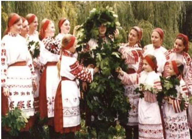
Het rondleiden van de Struik, Meisjesvolksritueel tijdens de Pinkstertijd voor een goede oogst, NW Oekraïne, Map Oost-Europese vrouwelijke volkscultuur en mythologie, Hans Eisma, 2014.

Voor vrouwen had het verlies van hun productieve rol daarom allerlei negatieve gevolgen. De ontwikkeling van akkerbouw leidde ook tot een snelle toename van sociale samenlevingen. Martin en Voorhies speculeren dat samenlevingen die zich in een overvloedig, bebouwbaar land ontwikkelden meest matrilineair waren, waarbij vrouwelijke familieleden zich voor de exploitatie van de gemeenschappelijke velden met elkaar verbonden en waarbij de gerelateerde mannen als verbindende schakels fungeerden tussen nakomelingen en lokale groepen. 32