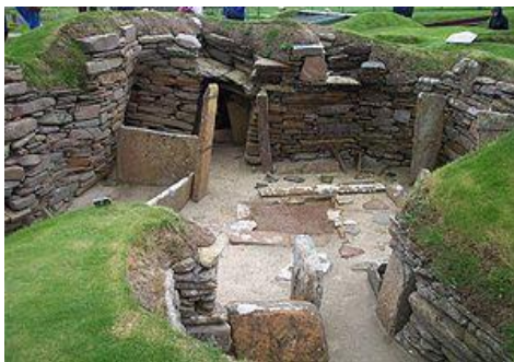
Neolithische woonstee, Skara Brae, Orkney

Op basis van archeologische vondsten verklaart ook de Britse archeoloog en paleo-linguïst Colin Renfrew, dat de landbouw zich vanuit de vruchtbare halve maangebied in alle richtingen verspreidde, maar het meest naar het Noordwesten van Europa.