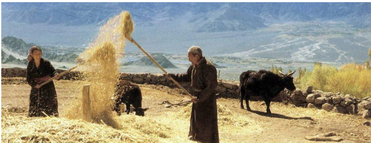
Met het wannen van graan zuiver je het koren van het kaf door het hoog in de wind op te werpen. www.waladakh.org

'Toen ik voor de eerste keer in Leh, de hoofdstad met 5000 inwoners arriveerde, waren koeien de meest voorkomende oorzaak van een verkeersopstopping en de lucht was kristalhelder. Op vijf minuten wandelafstand in iedere richting vanuit het stadscentrum lagen gerstakkers met kleine boerenwoningen als stipjes. Maar in de tien jaar daarna zag ik Leh veranderen in een stedelijk gebied met straten vol verkeer en luchtvervuiling en met ziellose, betonnen woonkazernes in een stoffige woestijn. De eens heldere waterbeken bleken vervuild en het water ondrinkbaar. Voor het eerst bestonden er ook daklozen. De toenemende economische druk veroorzaakte werkeloosheid en competitie en binnen een paar jaar ontstond er frictie tussen verschillende gemeenschappen. Al deze zaken hadden nooit bestaan in de vorige vijfhonderd jaar!' 49