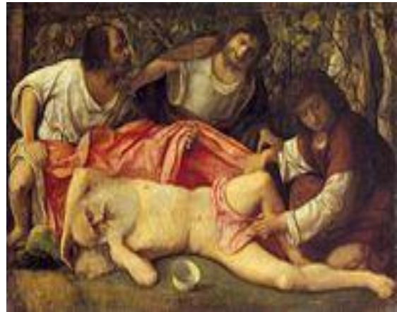
De dronkenschap van Noach, Giovanni Bellini, 1430-1516 Noach 's naaktheid kan ook het gevolg zijn van zijn verlies van eenheidsbewustzijn. Het contact met zijn vrouwelijke (creatieve en gevoelige) kant is dan alleen nog door dronkenschap te ervaren.

De verbanning uit het paradijs, de schraalheid van de aarde, de zwaarte van het leven, de onderdrukking van de vrouw, de verjaging van Kain, de overheersing van Kanaän: alle vervloekingen van Genesis worden vergroot door de herhaalde vermaning van hun God dat de mens zich moet vermenigvuldigen, over alle delen van de aarde trekken en heersen over alle andere vormen van leven. Ze zijn vervloekt omdat ze geen vaste thuisgrond hebben, akkers moeten bewerken en dieren verzorgen in gebieden die schraal en onbekend zijn. 15