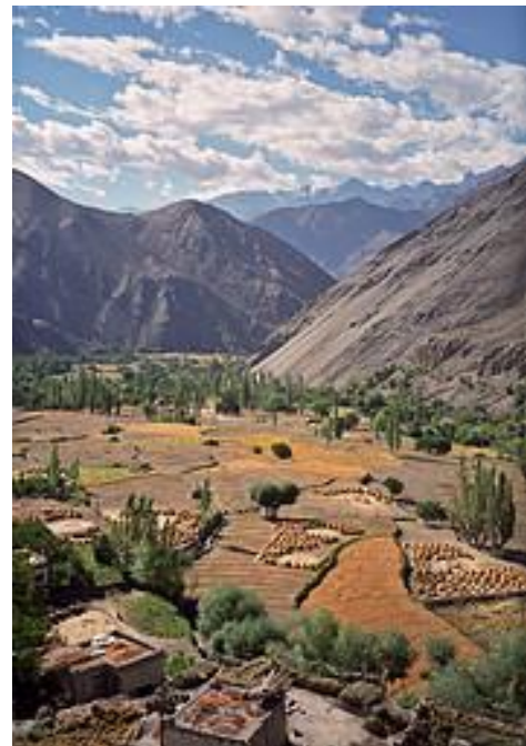
Eeuwenoude terrassenbouw, Themisgang village, Ladakh, Todd Merrifield, 1999.

Die verandering vormt de start van haar langdurige inzet om de duurzame en integere leefwijze van deze traditionele bevolking te beschermen en een wereldwijde beweging op gang te brengen die lokalisatie wil bevorderen d.w.z. het beperken van economische activiteiten tot een klein gebied. Zij stelt lokalisatie tegenover globalisering, die in haar ogen dramatische gevolgen heeft voor vreedzame en duurzame gemeenschappen zoals van de Ladakhi's. De organisatie die zij daarvoor opricht, heet thans Local Futures. 47