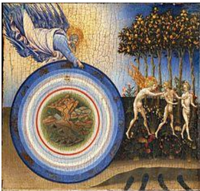
De schepping en verdrijving uit het Paradijs, Giovanni di Paolo, 1445.