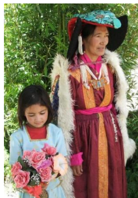
Moeder en dochter in traditionele klederdracht, waladakh.org.

Deze stabiliteit heeft op zijn beurt bijgedragen aan een balans in het milieu en in de sociale harmonie. Dat bevolkingscontrole een belangrijke factor vormt in het behouden van het milieuevenwicht is duidelijk. De link met sociale harmonie lijkt echter minder belangrijk, maar sociale onrust of strijd is veel minder aanwezig als het aantal mensen, afhankelijk van een vaste hoeveelheid van middelen, hetzelfde blijven van generatie tot generatie. Onder die omstandigheden is de behoefte om te grabbelen en te vechten voor overleving minimaal. 53 Hoe logisch is dat!