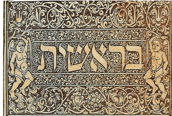
Berei'shit "In the beginning" opening word in Hebrew scripture of Genesis, www.electrummagazine.com .

Genesis is een universeel verhaal, stelt Brody, en niet zomaar een mythe, maar de mythe. Door de vorm als een gedicht is het absoluut geen wetenschappelijke verhandeling. Nog altijd is Brody onder de indruk van de magische klanken in de Hebreeuwse beginwoorden: 'Deze woorden klinken niet als flarden geschiedenis maar als de muziek van het begin van een wereld waarin mijn plaats met name genoemd wordt.' 10 Maar wiens levenswijze wordt hier weergegeven en onderschreven? Wiens standpunt wordt er gerechtvaardigd? Dit soort vragen moeten ook gesteld worden, meent hij. 11