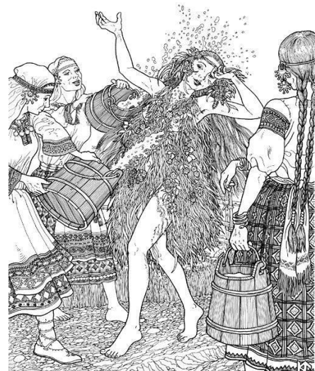
Het meisjes-volksritueel ter opwekking van regen tijdens een droge periode. Zuid-Slavische cultuur, Russische hedendaagse tekening van Nikoláj Fomín. Dodola. Map Oost-Europese vrouwelijke volkscultuur en mythologie, Hans Eisma, okt. 2013.

Daaruit kun je concluderen dat gelijkwaardigheid van de vrouw afhankelijk is van hoe wij ons als bevolkingsgroep wat betreft voedselvoorziening tot de natuur verhouden. JV zijn het meest duurzaam, want hun leefwijze is gebaseerd op een diep respect voor de natuur, waarmee zij één zijn: Niet zorgen voor het land betekent een moreel risico dat spiritueel gevaar met zich meebrengt 36 .